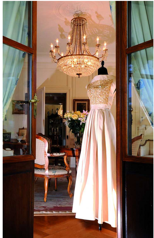
Robe Philippe Venet