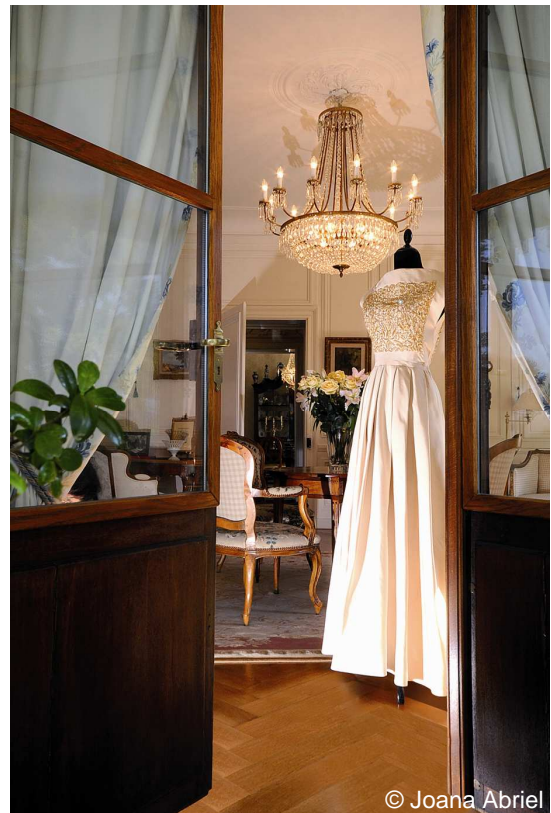
Robe Philippe Venet