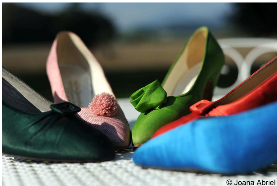
Chaussures René Mancini