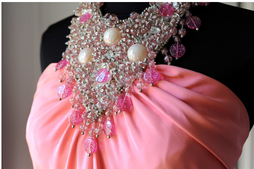
Détail de robe Molyneux